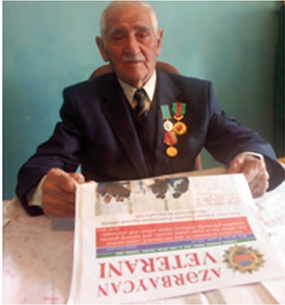
Bu gün cavanların çörəkdən də çox Ağsaqqal sözünə ehtiyacı var!

İctimai qınağın olmadığı bir zamanda cəmiyyətin müdrik ağsaqqallara həmişə böyük ehtiyacı olmuşdur. Bizim zamanda uzaqgörən və cəsarətli ağsaqqallara olan ehtiyac özünü daha qabarıq şəkildə göstərir. İctimai böhranın, ictimai-siyasi hadisələrin gərginləşməsinin qarşısının alınmasında, ölkədə sabitliyin qorunub saxlanılmasında ağsaqqalların xidməti böyükdür. Əsl ağsaqqal ictimaiyyətin işıqlı ziyalı kimi dövlətimizin bütövlüyü, millətimizin milli-mənəvi dəyərlərinin qorunması, xalqımızın rifah halının yaxşılaşdırılması istiqamətində fəallıq göstərməlidir. Həm xalqı, həm də dövləti düşünməli, dövlət-xalq münasibətlərində ədalətli mövqə tutmalıdır.